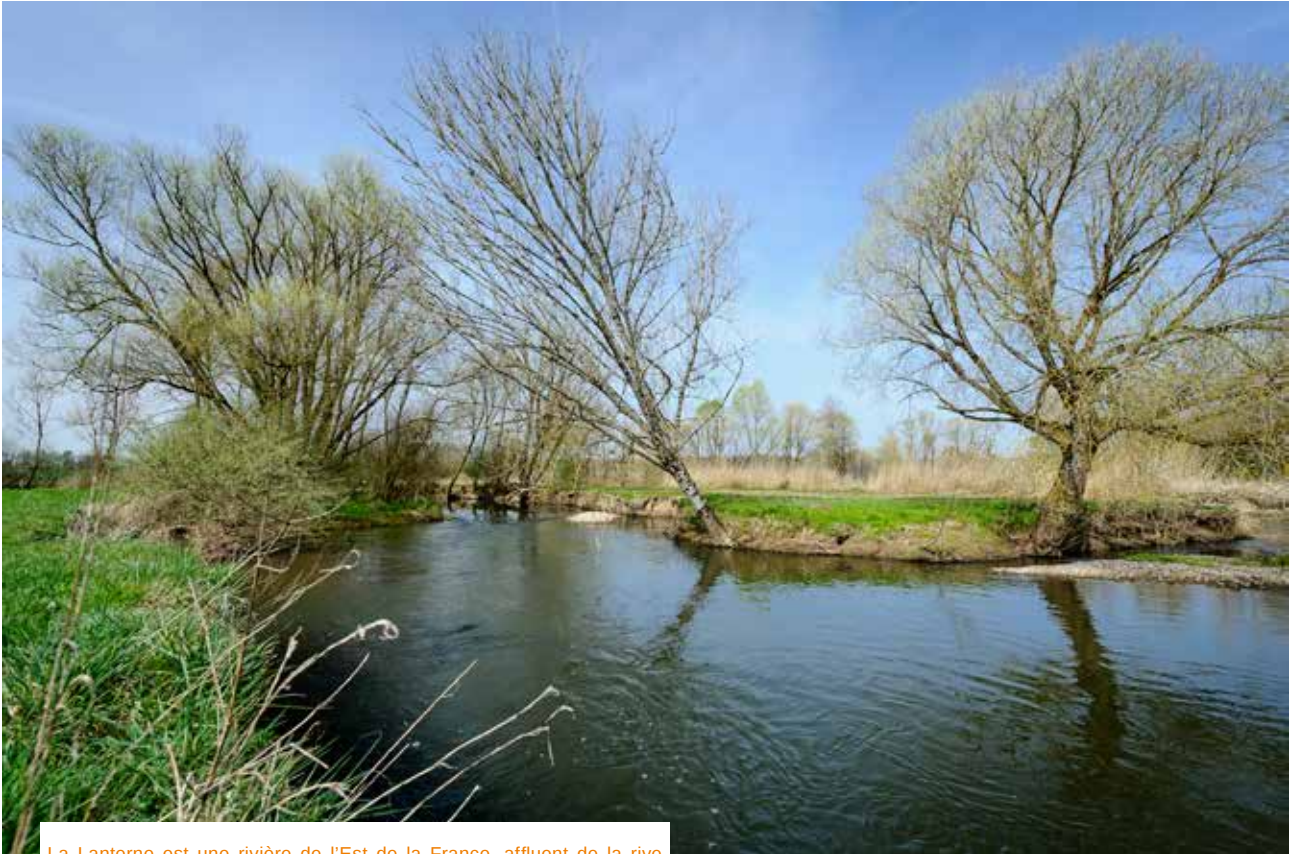
La Lanterne est une rivière de l'Est de la France, affluent de la rive gauche de la Saône, et sous-affluent du Rhône.