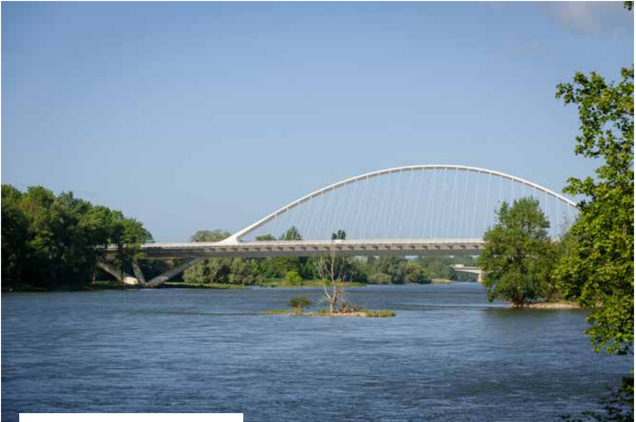
Pont de l'Europe à Orléans.