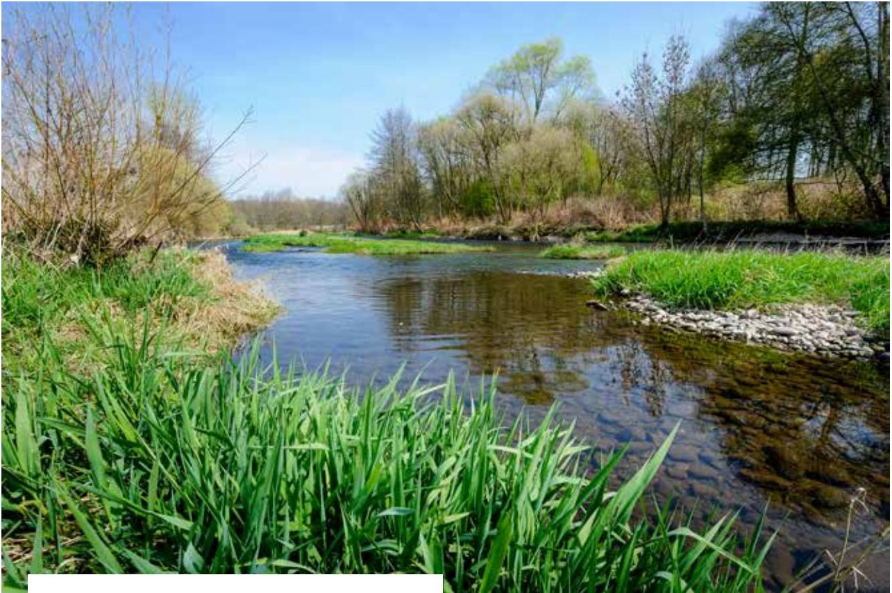
Ruisseau «Le Morbief» à La Corveraine (70)