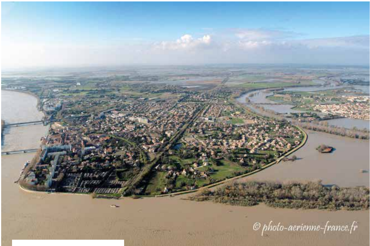
Le quartier Trinquetaille d'Arles